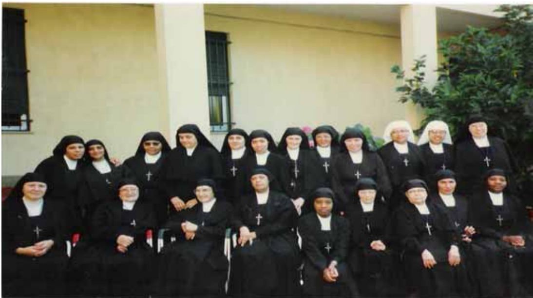
Irmãs reunidas na Casa Mãe para o Canítulo que se realiza de seis em seis anos